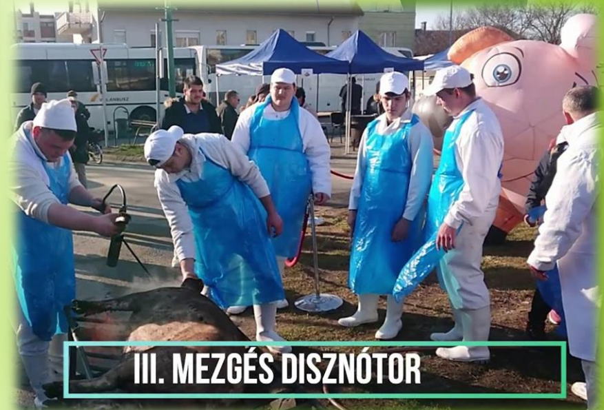
III. MEZGÉS DISZNÓTOR